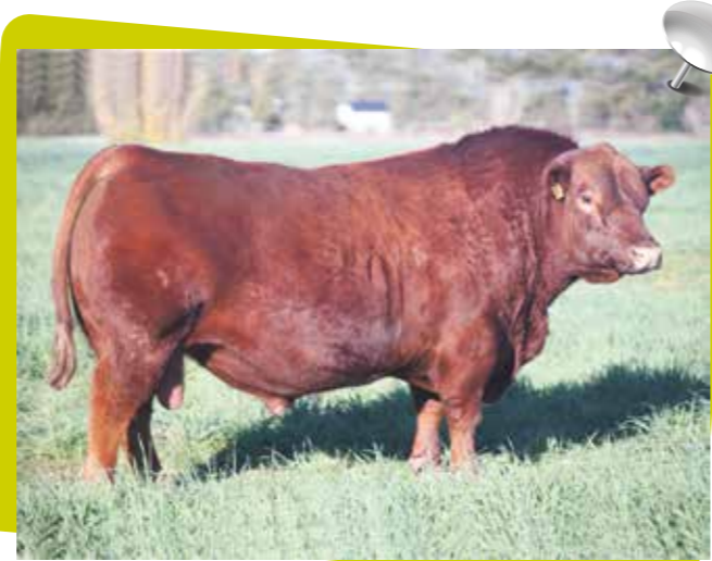
CARRILERO BRIGADIER X REAR END

✉ www.ciado.com @ ciadosh@gmail.com 📞 +549 2923 - 458690 📠 02924 - 420307