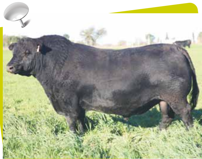
PINCEN PAXTON X DEFINIDO